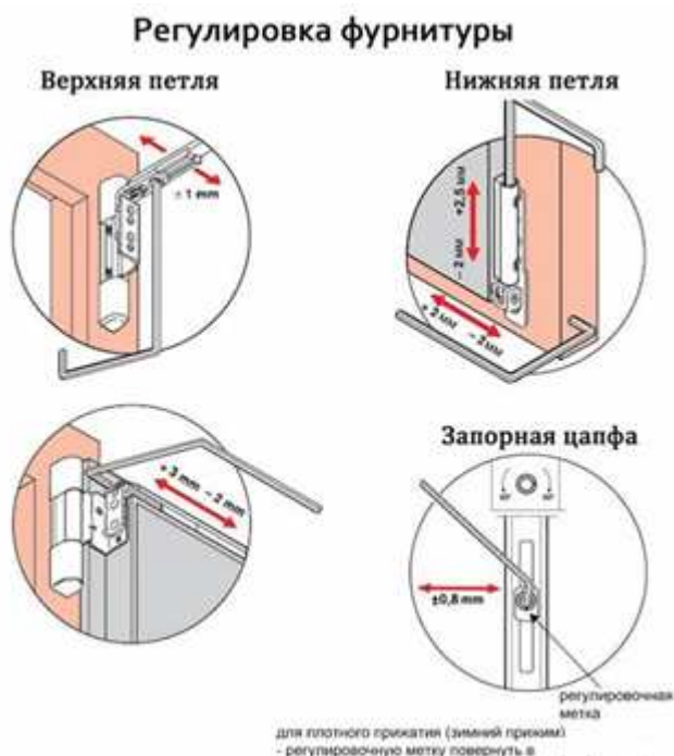
Рисунок 3. Регулировка фурнитуры

3. Проверка. Можно провести проверку, взяв обычный бумажный лист. Для этого необходимо положить листок между рамой и створкой перед закрытием. После этого следует потянуть лист. Если листок выходит без особого труда, то окно до сих пор осталось в летнем режиме. Если же бумага порвалась при попытке ее вытащить, то все сделано верно, и пластиковое окно находится в зимнем режиме.